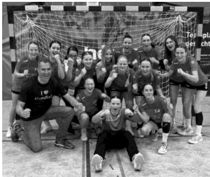
Die weibliche B-Jgd. siegt beim Pfingstturnier in Verl

Zum Saisonabschluss nahm die weibliche B-Jugend am internationalen Pfingst-Turnier im ostwestfälischen Verl teil. Zur großen Überraschung der Zuschauer schafften es die Mädels dabei nicht nur ins Finale, sondern konnten nach bravouröser Leistung sogar das tschechische Top-Team Hazena Kynzvalt 15:14 nach 7m-Werfen besiegen.